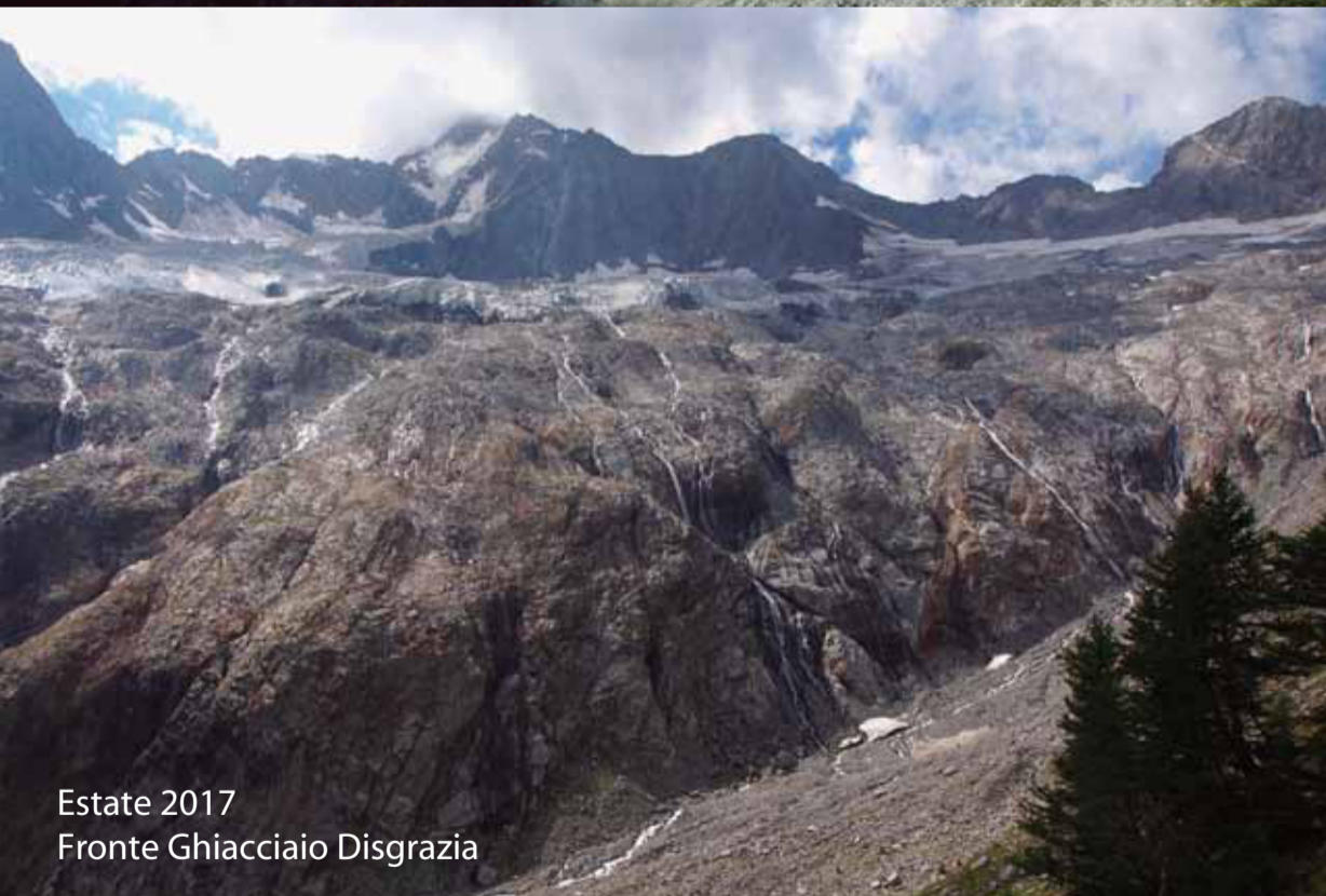
Estate 2017 Fronte Ghiacciaio Disgrazia