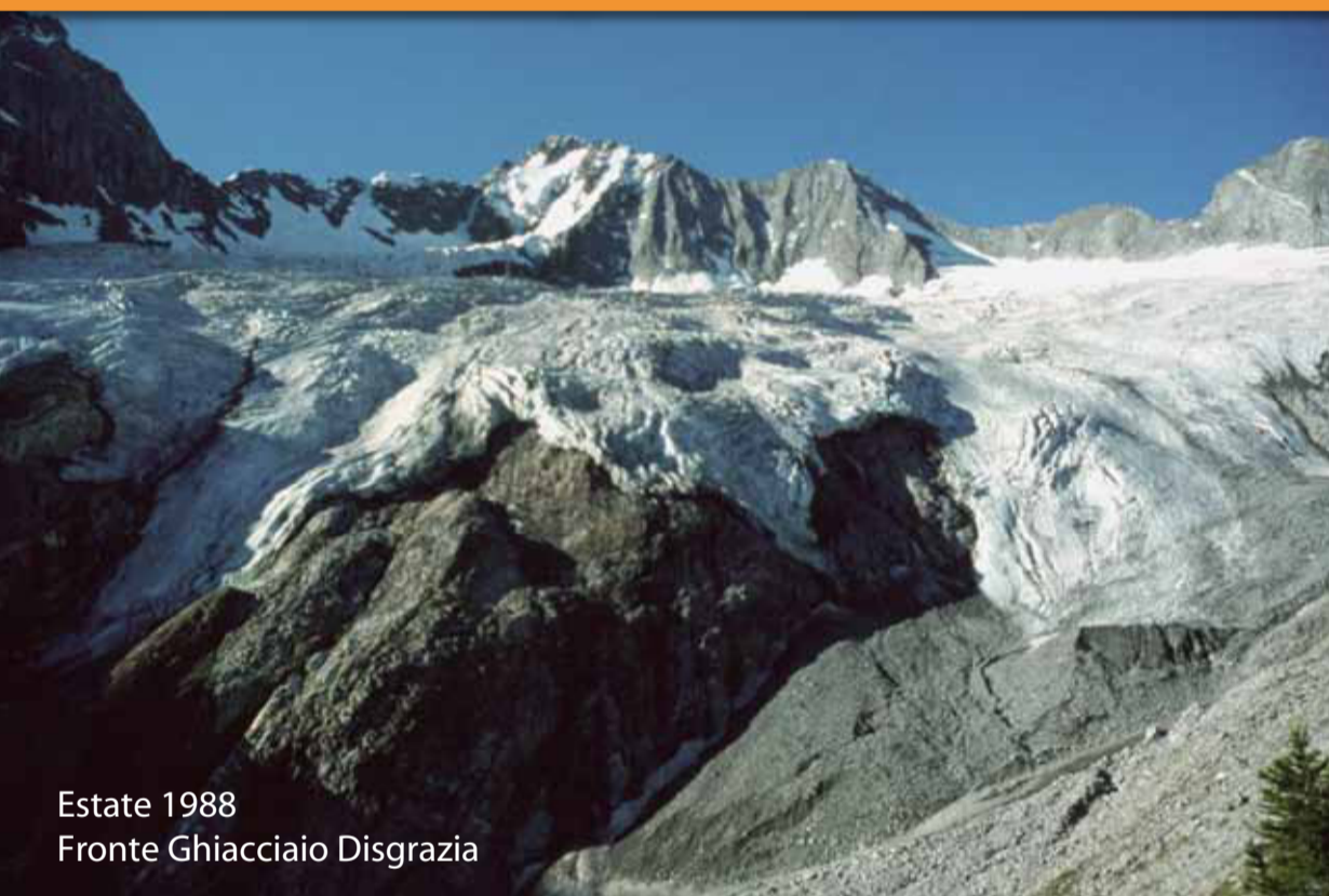
Estate 1988 Fronte Ghiacciaio Disgrazia