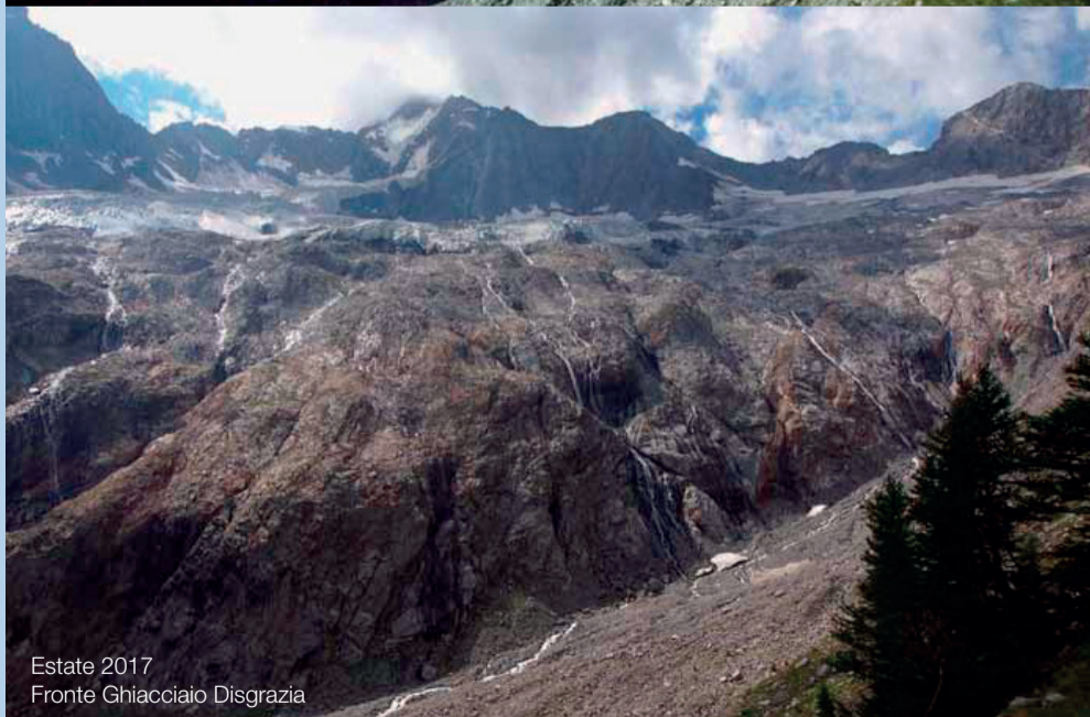
Estate 2017 Fronte Ghiacciaio Disgrazia