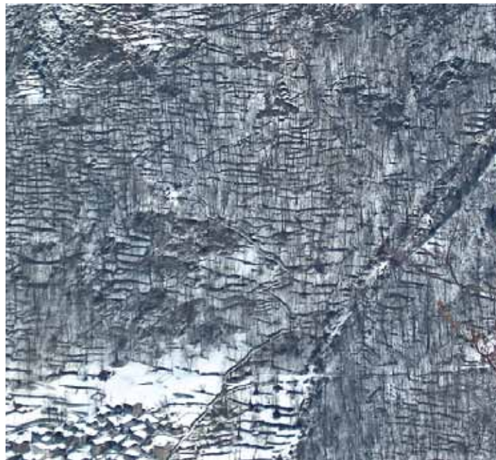
L'inverno svela il passato