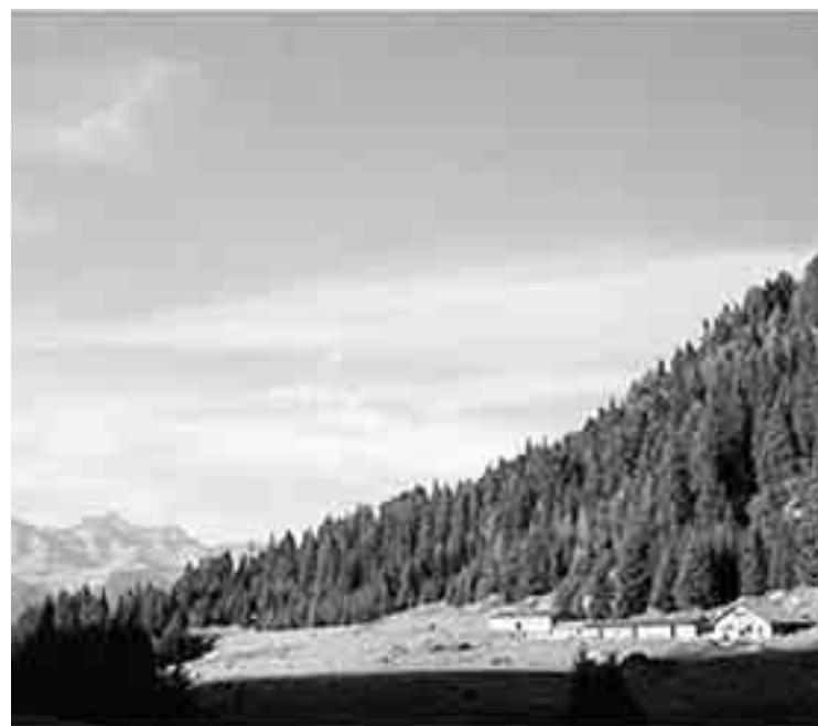
Alpe Armisola - foto dei Cas

■ Un secondo percorso, in qualche modo analogo per ambientazione e orientamento, ma diversissimo per caratteristiche oro-idrografiche del ver-